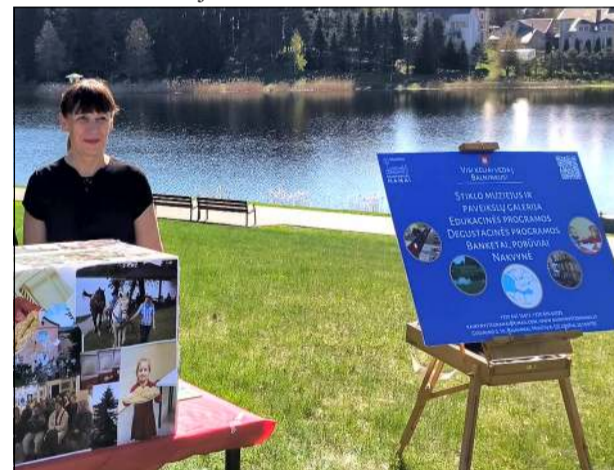
Viena iš dėlionės detalių buvo Balninkų "Kaimynystės namų" įkurtose stovyklose Skulptūrų parke

vadovauja jau 15 metų. Sako, jog daug, bet minčių vis dar yra, juolab, kad suburtas puikus kolektyvas. Klausinama, kokią įsivaizduoja ateitį