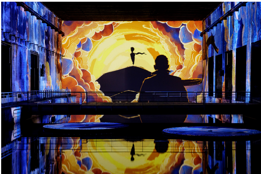
© Culturespaces / V. Pinson - Le Petit Prince® © Succession Antoine de Saint-Exupéry – 2024

Cette exposition immersive convie les visiteurs à découvrir ou redécouvrir « Le Petit Prince » sous un nouvel angle. Les aquarelles et les mots de Saint-Exupéry prennent vie sur les sols et les murs, nous transportant dans un monde où l'imaginaire n'a pas de limite. Les roses, les renards et les serpents parlent, et nous voyageons de désert en prairie, de planète en planète sans la moindre difficulté, car ni le temps ni l'espace ne semblent avoir d'emprise.