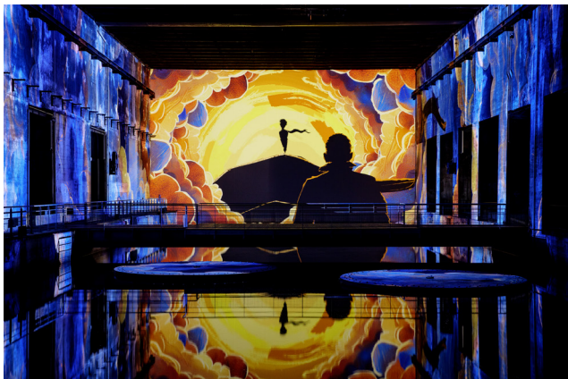
Le Petit Prince® © Succession Antoine de Saint-Exupéry-2024