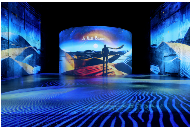
Le Petit Prince® © Succession Antoine de Saint-Exupéry-2024