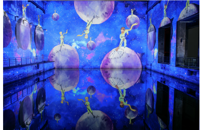
© Culturespaces / V. Pinson - Le Petit Prince® © Succession Antoine de Saint-Exupéry-2024