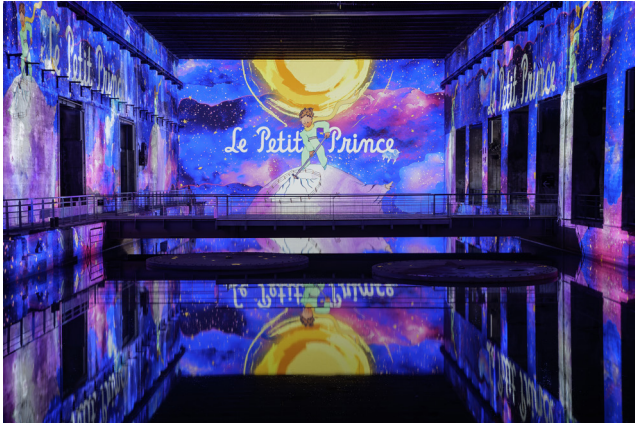
© Culturespaces / V. Pinson - Le Petit Prince® © Succession Antoine de Saint-Exupéry-2024

© Culturespaces / V. Pinson - Le Petit Prince® © Succession Antoine de Saint-Exupéry – 2024