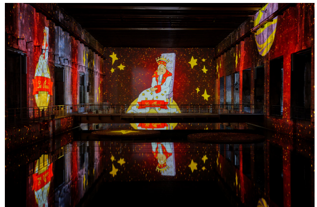
Le Petit Prince® © Succession Antoine de Saint-Exupéry-2024