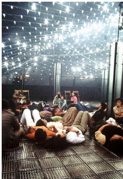
DIATOPE DE BEAUBOURG, 1978

Le parcours de l'exposition replace l'œuvre de Xenakis dans son histoire et dans sa culture visuelle, littéraire et musicale. Conçu de manière chronothématique en six tableaux, il s'appuie sur une vingtaine d'opus, musicaux ou architecturaux, mis en regard de nombreuses œuvres visuelles et pièces d'archives émanant de la collection privée Xenakis. Une place centrale est donnée à l'atelier du compositeur, qui, par l'évocation de l'univers intime du créateur, donne à voir la force et la radicalité d'une pensée sans cesse réinventée.