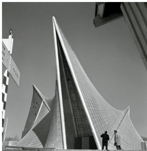
PAVILLON PHILIPS, EXPOSITION UNIVERSELLE, BRUXELLES, 1958