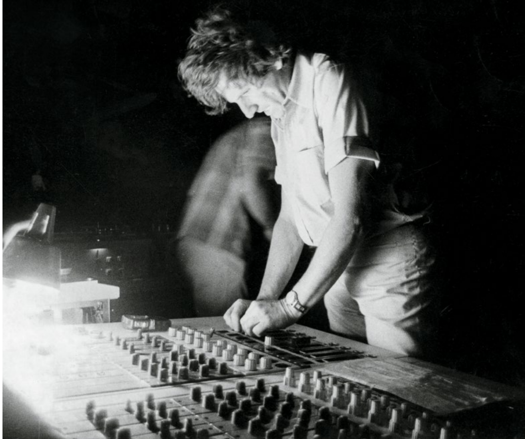
IANNIS XENAKIS EN CONCERT AU FESTIVAL DE CHIRAZ-PERSÉPOLIS, IRAN, 26 AOÛT 1971